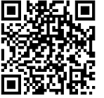
定額減税特設サイト

尚、国税庁では国税庁ホームページ内に定額減税に関する特設サイトを開設しております。